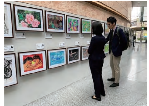
「可能性アートプロジェクト展」の様子

障害のある方が制作した絵画を、自社独自の印刷技術である「プリマグラフィ」を活用して額装し、作品として展示する「可能性アートプロジェクト展」を実施しています。また、プロジェクトを通じて得たユニバーサルデザインの視点を生かして、絵画にスマートフォンをかざすと作品が動き出し、作品に込めた想いを聴くことができる AR コンテンツも制作しました。