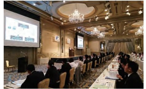
事業所ごとの取組を経営陣の前で報告している様子

「ダイバーシティ推進活動」では、障害のある方への情報発信を重点項目に位置付けています。車椅子ユーザーの従業員の発案により、ホームページ上に「ユニバーサルデザインへの取り組み」ページを作成し、各ホテルの詳細なユニバーサル情報を写真付きで発信しています。