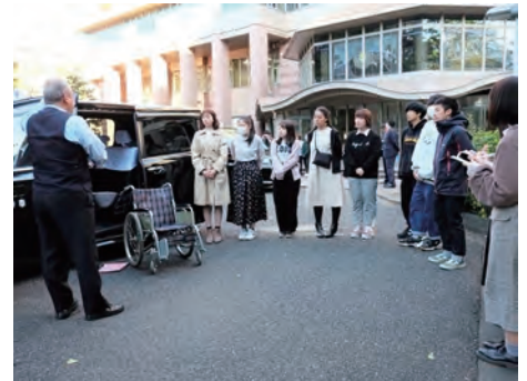
地元の大学でのUDタクシー講習