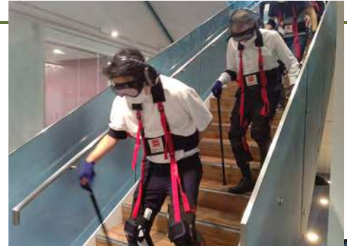
サステナブルウィークスで実施した障がい者理解体験型研修の様子

障がい者アート「Art of the Rough Diamonds展」を年に一度開催しています。当グループは障がいの有無だけでなく、多様な背景を持つ人々が自分らしさを大切に、共に働く仲間として理解尊重する企業文化を醸成しています。エンタテインメントを通じて、障がい者の活躍の場をつくりたい、その才能に触れる機会を提供したいという想いから取り組んでいます。