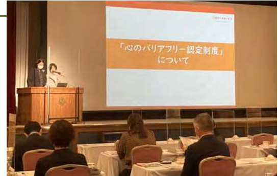
全国の宿泊施設様へ「心のバリアフリー認定制度」のセミナー開催

日本国内において就労が困難と言われる在留外国人障害者のサポートを開始しました。まずは自社でコロンビアとタイの聴覚障害者を採用し、業務で必要な日本語の理解促進を図っています。またNPOと連携し、数十人の外国人聴覚障害者に対して日本語理解講座とビジネスマナー研修を実施予定です。