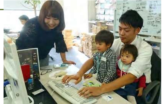
仕事参観日の様子

社員の定着率の高さから、精神障害のある社員の雇用と定着のための支援体制に関する講演やテレビ出演など多くの機会を頂いています。このような活動を通じて、当社のノウハウを地域社会に還元しています。(実績:NHKハートネットTV「精神障害者の就労」出演(2018)、東京ライフ・ワーク・バランス認定企業 知事特別賞(2019)、企業見学受け入れ、他)