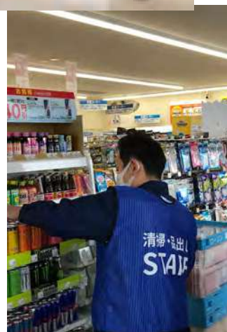
担当業務を記載したビブス着用の実験