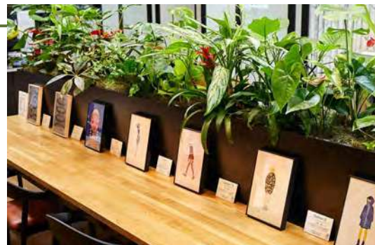
パラアーティストグループ「COLORS」の本社展示会での作品

エスプールプラスに所属するパラアーティストグループCOLORSでは、障がいのあるアーティストが個性・キャリアを生かし芸術活動を行っています。アーティストが創作活動に専念できるよう、福祉の有資格者をサポートにつけ、障がい特性を鑑みたハイブリットワークを導入しています。また、キャリアアップも目指し、東京藝術大学の教授を講師に迎え、1対1で指導を受ける場を提供しています。