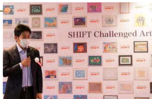
SHIFT Challenged Art 公募展 総評の様子

イベント装飾や年4回程度の社内表彰で贈呈する花を、栽培からアレンジメントまで自社で担っています。障がいのある社員を含め様々な社員が関わり、各自の才能を生かし活躍しています。ともに働く社内のメンバーが育てた花を貰った社員からは、モチベーションが向上し、所属意識が育まれたという声もあります。