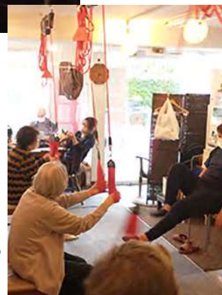
年齢、障害、国籍に関わらない地域のご利用者様 & スタッフの共存