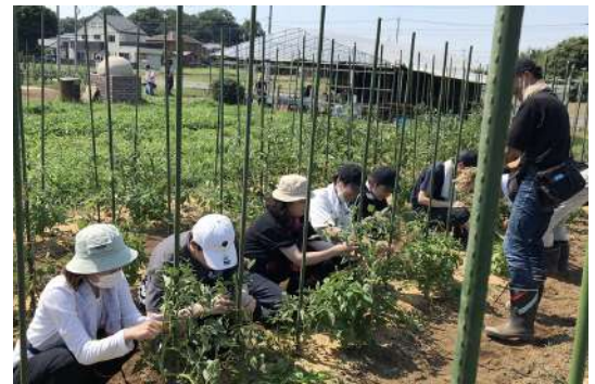
障がいの理解と地域密着の取組を体験する農場就労体験実習