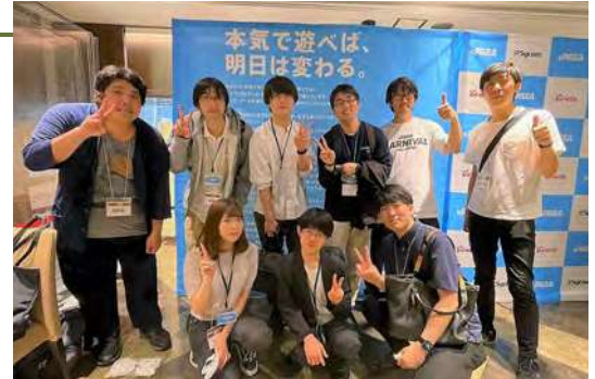
eスポーツ部とグループ企業の混合チームでイベント出場

障がい者雇用のノウハウを基に、他企業向けの無料セミナーやメールマガジン配信。また、障がい者が製造に携わる商品の販売サイト「まるんと」も運営しています。さらに、個性的なキャラクターとの関わり方をゲームを通じて体感でき、障がい特性の理解や合理的配慮の方法などを学べるボードゲーム「ズバリ 気配り アニマッチ」を共同開発し、障がい理解の一助としています。