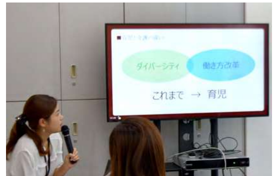
仕事と介護の両立支援セミナーの様子