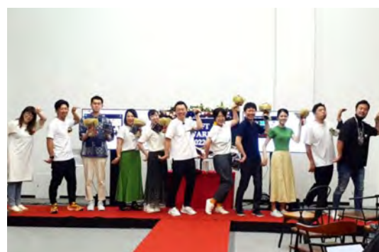
「SHIFT Award 表彰式」にて花ブーケを持つ受賞者達