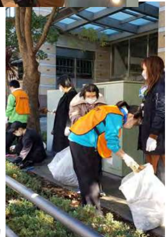
大崎駅周辺での花壇整備等のボランティア活動