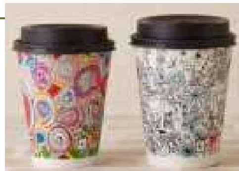
障がいのあるアーティストが描いたデザインのMACHI caféカップ

20名の障がいのあるアーティストが描いたデザインのMACHI caféカップを2022年2月より全国の店舗に展開、社内向けのSDGsハンドブック(表紙)にも採用されました。さらに、東京と神奈川の3店舗でトイレ全面をアートシールでデコレーションした「アートトイレ」、ポストカード、シール、店内マルチコピー機、ボックスティッシュのデザインとしても展開しています。