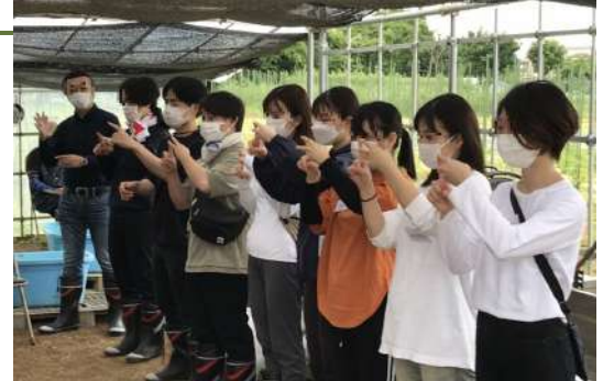
農場で毎日おこなう手話朝礼、ミニ手話講座の様子

障がいを持つ社員が農場で有機野菜を栽培し、近隣の店舗で販売する地域密着の取組を実施し、地域での障がいの理解を促進。その様子を全社で体感するため、新卒新入社員全員、及び希望する社員が農場での就労体験実習を行っています。また、農場で働く社員の家族を対象とした業務報告会や収穫祭を実施することで、家庭と連携して定着をサポートしています。