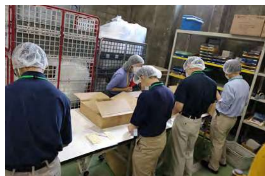
東京都立港特別支援学校とのパートナーシップ実習の様子