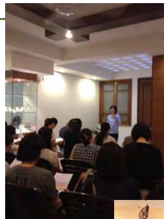
インドの邦人向け「現地の気候におけるヘルスケア」の授業を提供

高齢者、障害者、難病や産前産後の方向けのヘルスケア、ヘルスケア教育や言語アシスタントの提供により、健康状態や年齢、障害の有無、国籍に関わらない共存を可能としています。サービス提供における配慮事項は体系化され、各スタッフの気付きを踏まえブラッシュアップし共有しています。