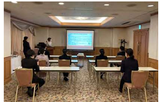
宿泊施設様に対して心のバリアフリー認定に向けた各種研修の実施