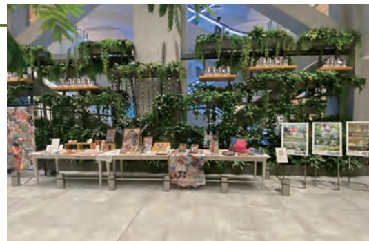
玉川高島屋において開催した「障害者の芸術の世界」

認知症の方やご家族、地域住民、医療・福祉関係者でタスキをつなぐイベントを当法人の地域包括支援センター主催で2回開催。認知症の方々が笑顔で参加され、安心して地域で暮らし続けることができることを実感していただきました。「一人ひとりの希望及び権利が尊重され、ともに安心して自分らしく暮らせる街」を目指している世田谷区に賛同し、認知症カフェを4事業所で開催しています。