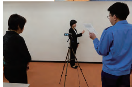
自主制作の手話研修動画 撮影風景