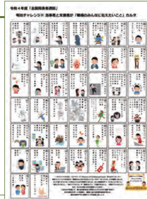
当事者と支援者が職場のみんなに伝えたいことカルタ

人の数だけある様々な想いに寄り添うバレンタインを目指して、昨年より一部商品をDiversityパッケージとして発売しています。またMeltykissという冬期限定の商品パッケージにおいて、色覚に障害をお持ちの方も包装の絵柄から風味がわかりやすいように改良しました。見えない想いを形にすることで、多くのお客さまから感謝のお言葉をいただいています。