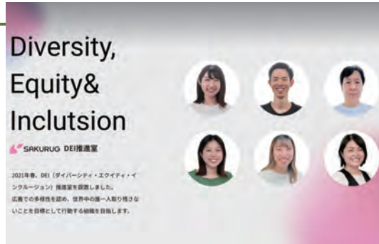
多様なメンバーたちのバリュー発揮のため活動するDEI推進室

サクラグが運営する『Sangoport(サンゴポート)』では、性別、年齢、国籍など「はたらく」のあらゆるハードルに向き合い、多様な人材との出会いから組織づくりまでダイバーシティ経営の総合サポートを提供しています。採用支援をはじめ、DEI研修プログラムの導入支援、『みんなのDEIセミナー』開催など、企業のDEIな組織づくりを多方面からサポートしています。