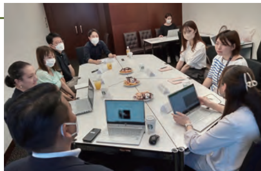
「子育て中社員の働き方」など様々なテーマで座談会を実施

多国籍の社員を配置する専門組織「International Front Center」、および5カ国語対応のお部屋探しサイトを設け、外国籍のお客様のお部屋探しから入居後までの一貫したサポートを提供しています。外国籍のお客様特有のニーズへの対応を進めながら、日本国外から来る労働者や留学生に快適な住まいを提供するという社会的課題解決の一端を担っています。