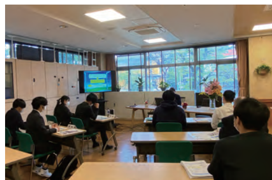
入社後に行った障害者理解の研修の様子