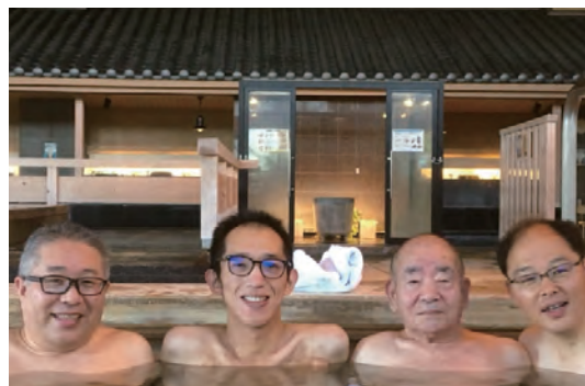
旅行代理店と連携したオストメイト向け温泉ツアー(第1回)