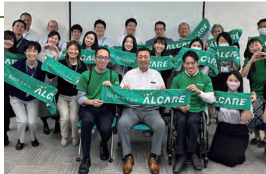
10月は障害の理解を深める月間(2023年開催時)

2015年より、所属パラアスリート社員が小中学生に向けてパラスポーツや自身の障害、車いすの方への声掛けや介助方法について出前授業を行っています。また、オストメイトの社会的認知拡大と理解促進に向け、外部団体が実施するイベントへの協力や防災の日をきっかけとした災害対策などのニュースリリースを発信することで、誰もが自分らしく生きられる社会の実現を目指しています。