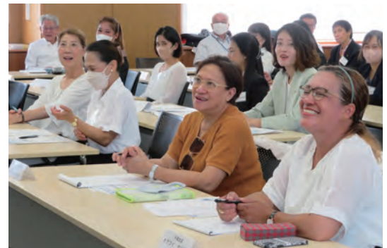
外国人研修会の様子