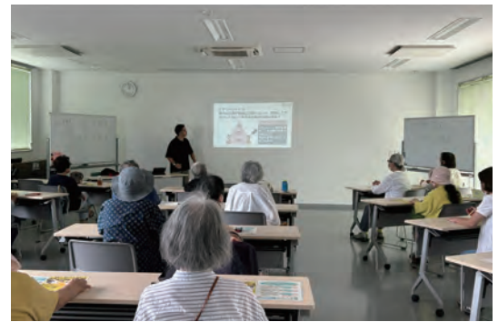
シニアの方向けにみんなの情報モラル講座を実施している様子