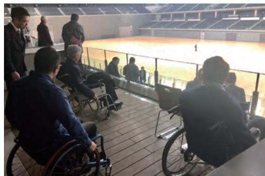
「心のバリアフリー」教育における「車椅子体験」の様子