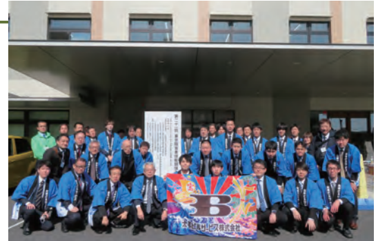
アビリンピック競技会集合写真

施設を利用する方には老若男女、障害者、外国人がおり、障害者一人ひとりの特性、また国々で違う様々な習慣や風習、そして年配者の状況があることを踏まえ、弊社管理物件において、見落としがちな段差や溝など事故の危険性が高まる箇所には、適切な誘導、危険表示や目立つ色を付けるなどの注意喚起、施設所有者への改善提案などにより施設利用者の安全確保に努めています。