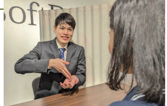
手話カウンターにてお客様に説明している様子

何らかの理由で長時間勤務が難しい方が週20時間未満という短時間の就労環境を整えることで「共に働く」を実現できる働き方「ショートタイムワーク」を推進しています。これまで72名の働く機会を創出してきました。また2018年に発足した「ショートタイムワークアライアンス」は、地域や業界の垣根を超え、この働き方を世の中に広め、誰もが働きやすい環境づくりを目指しています。