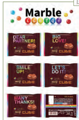
CUBIEダイバーシティパッケージ