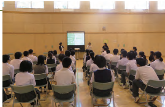
区立中学校での「福祉体験授業」の様子

都内の障害者就労移行支援事業所の利用者を対象に、Web・デザイン・バックオフィスなどに関する業務セミナーや研修を実施している。また、10年以上前から都内の学校や団体向けに出張授業（手話・車椅子・視覚体験、セミナー、ワークショップ等）を開催しています。このほかにも、多くの自治体、企業等から職場見学や情報交換の依頼があり、共生社会実現に向けて幅広く連携を図っています。