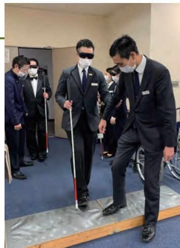
介助サポート力向上セミナー (視覚障がい者・サポート者体験)

2022年度より保有語学資格やTOEICスコアに応じ人事評価に加点する制度を設け、語学力の底上げを図っています。また、2023年度は英会話スクール通学等の補助を行った他、外国人研修生とのコミュニケーションを通して効果的な学習方法、ならびに異文化理解を深めました。これらの取組により、回復傾向の訪日客へのより踏み込んだ接客を目指しています。