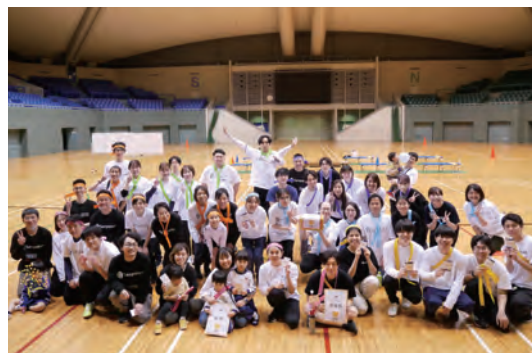
サクラグDEI運動会の様子